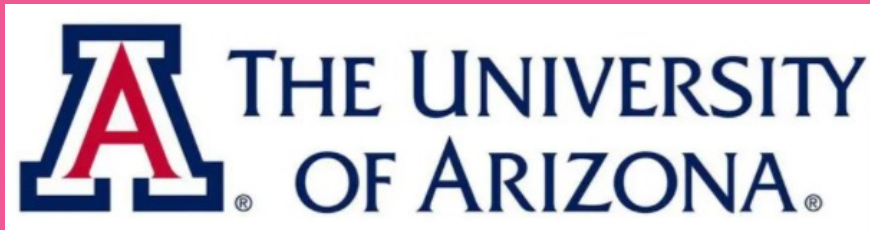
亚利桑那大学教授团队

拥有扎实的教育经验和海外行业背景。学生在学习专业课程的同时，与外教沟通和协作，将所学的知识转化为国际经验。