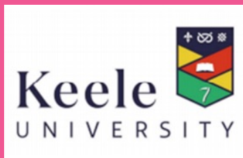
基尔大学教授团队